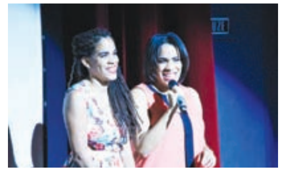
RBC Royal Bank's Art Rules ta bek Les a B13